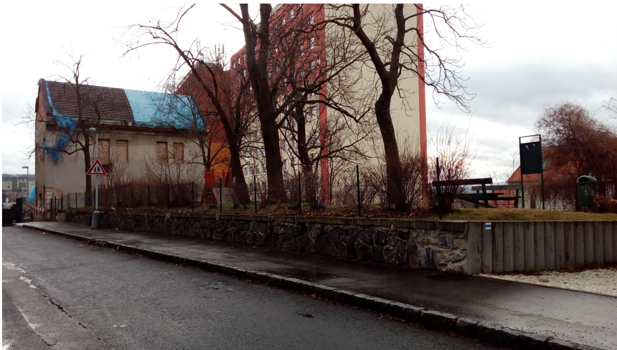
CELKOVÝ POHLED NA ZAHRADU