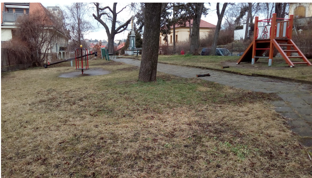
PODHLÉD NA VYBAVENÍ ZAHRADY