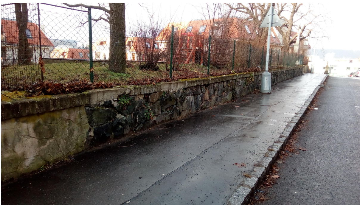
OPLOCENÍ DO UL. POD SADY