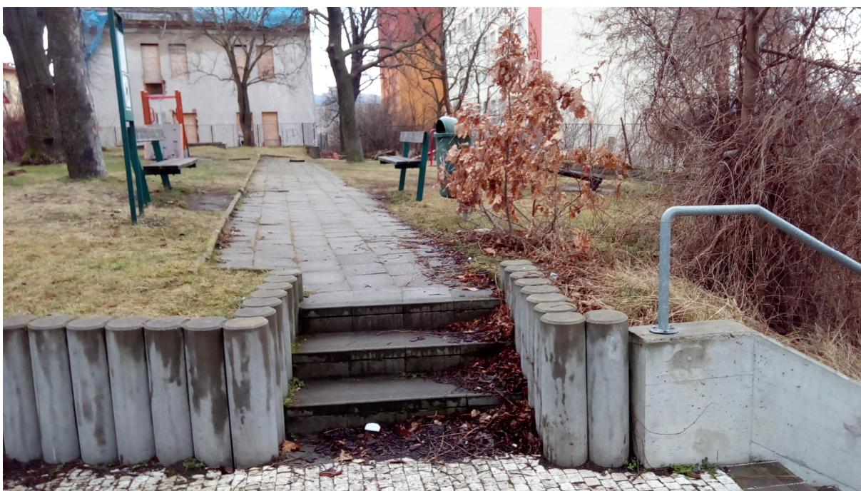
NEJSEVERNĚJŠÍ CÍP ŘEŠENÉHO POZEMKU – POHLED KE STÁVAJÍCÍMU OBJEKTU