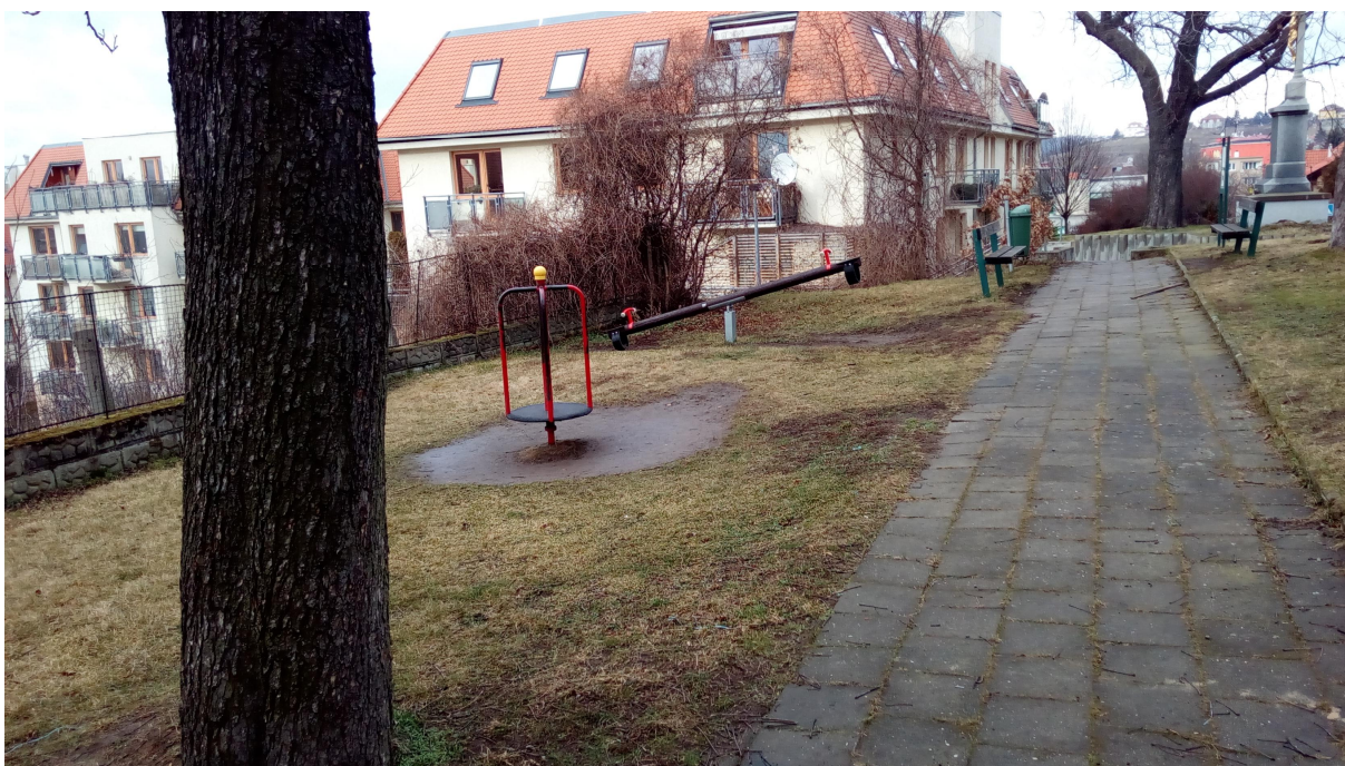
SEVERNÍ POHLED DO ZAHRADY