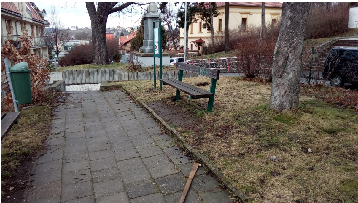
NEJSEVERNĚJŠÍ CÍP ŘEŠENÉHO POZEMKU