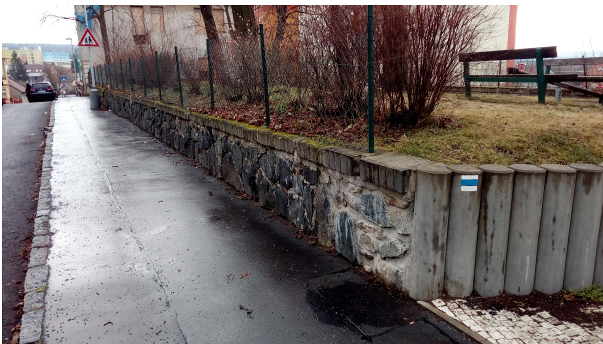
POHLED NA ULIČNÍ CHODNÍK A OPLOCENÍ ZE SEVERU