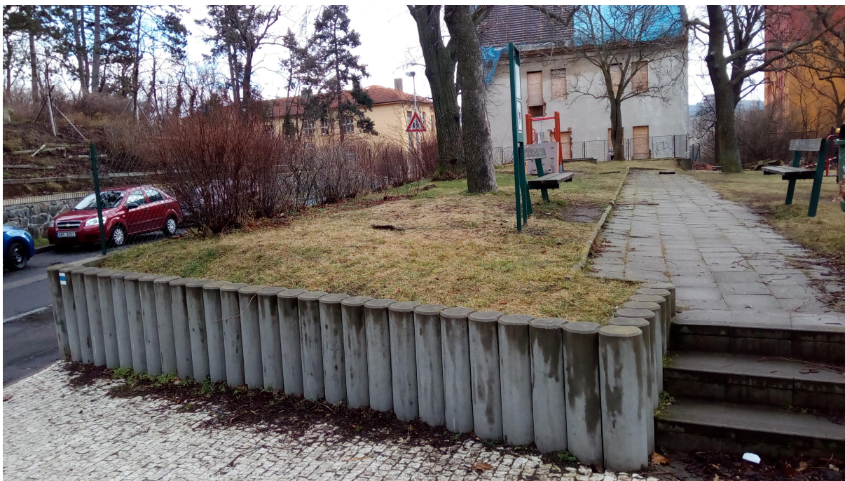
POHLED NA PALISÁDY NA SEVERNÍM CÍPU