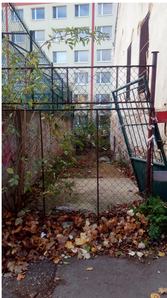
PROSTOR MEZI OPLOCENÍM STÁVAJÍCHO HŘIŠTĚ A OBJEKTEM