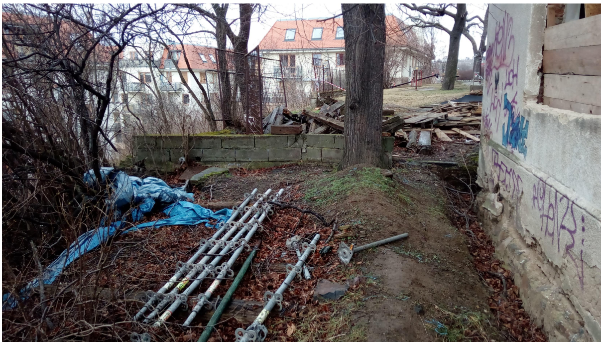
ZADNÍ OPĚRNÁ STĚNA U SZ ROHU STÁVAJÍCÍHO OBJEKTU